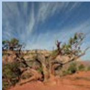
Grand Canyon Nationalpark (USA) Grand Canyon National Park