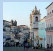
Historisches Zentrum von Salvador de Bahia (Brasilien) Historic Centre of Salvador de Bahia