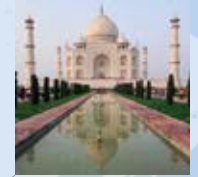
Taj Mahal (Indien) Taj Mahal