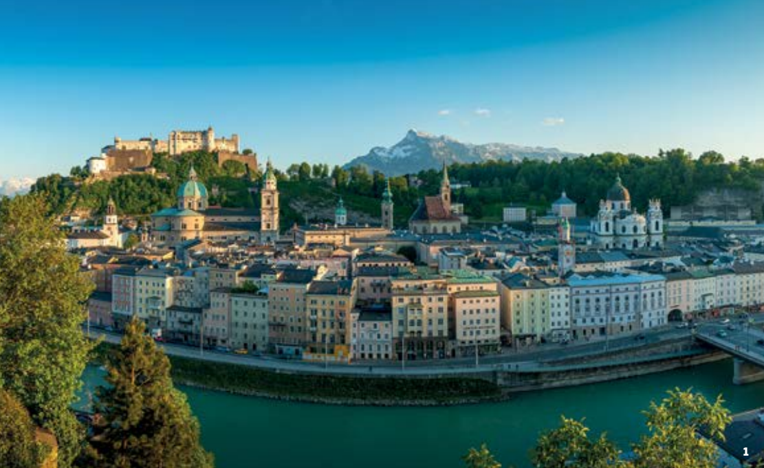
1  2