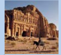
Petra (Jordanien) Petra