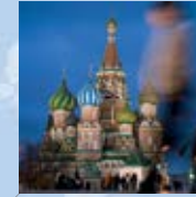
Moskauer Kreml und der Rote Platz (Russische Föderation) Kremlin and Red Square, Moscow