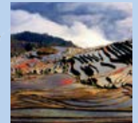
Kulturlandschaft von Honghe Hani Reisterrassen (China) Cultural Land- scape of Honghe Hani Rice Terraces