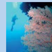
Great Barrier Reef (Australien) Great Barrier Reef