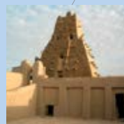
Timbuktu (Mali) Timbuktu